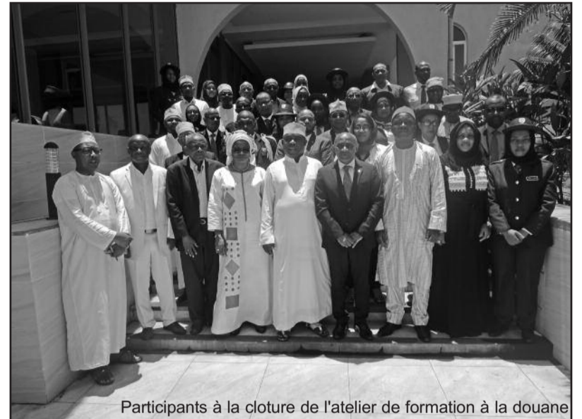
Participants à la cloture de l'atelier de formation à la douane

Le directeur général des douanes Comores propose un plan d'action à mettre en œuvre pour poursuivre la dynamique engagée afin de répondre aux attentes et aux conditionnalités de l'organisation. « Nous prions de déposer l'instrument d'adhésion dans les délais impartis », lance Souef Kamalidini. Le ministre des Finances, au nom du gouvernement a pris l'engagement d'accompagner l'administration des douanes à satisfaire les conditions préalables à l'adhésion à cet instrument. « Nous nous sommes engagés à intégrer la Zone de libre-échange continentale et se conformer à tous les instruments comme la Ckr et l'accord sur